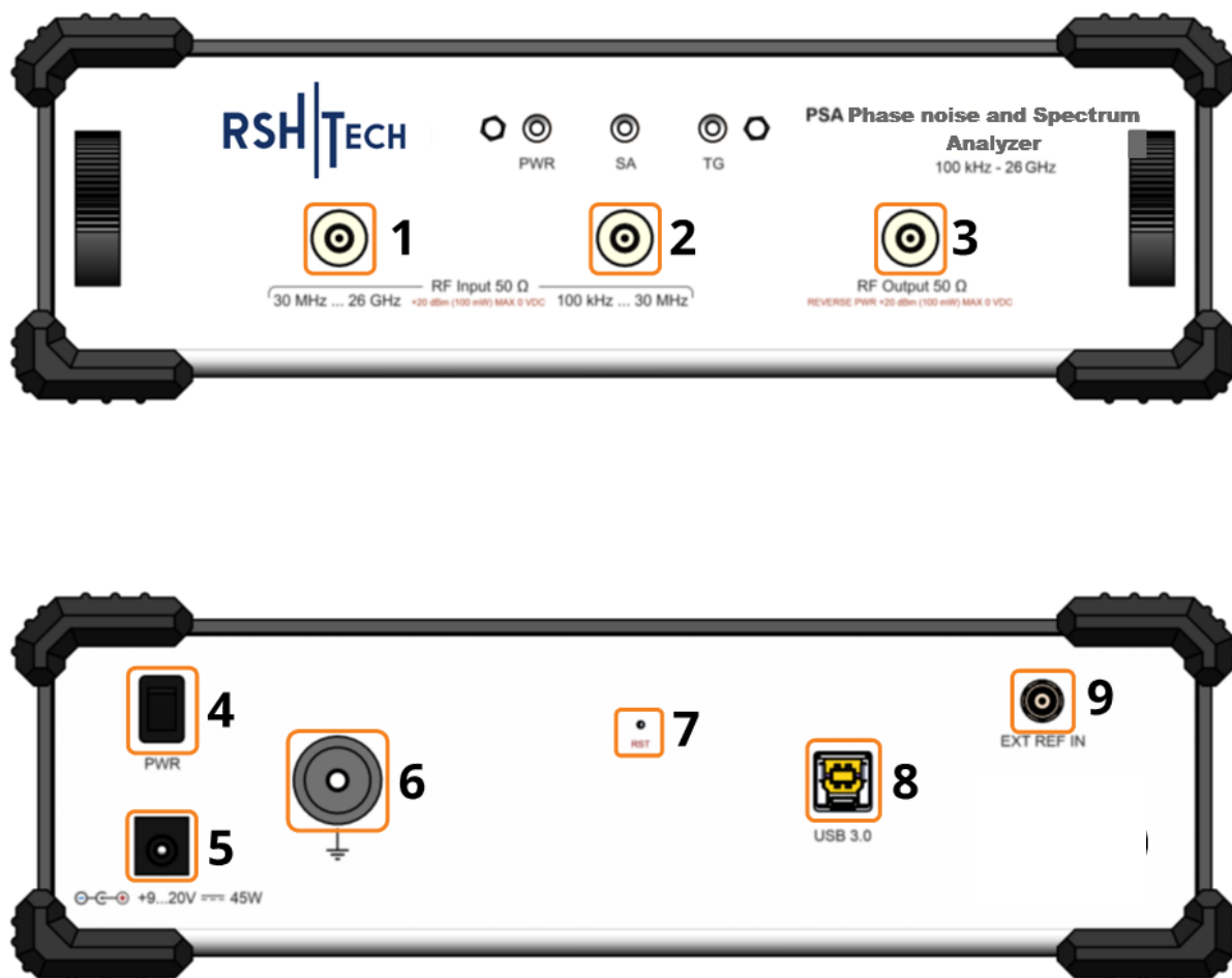
рис 2. Передняя и задняя панель.